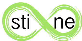
Abbildung 1: Das Logo der sti:ne

Um sich als Gruppe zusätzlich nach außen präsentieren zu können, haben sie ein Logo und ein Flyer/Plakat entwickelt. Das finale Logo ist in Abbildung 2 zu sehen.